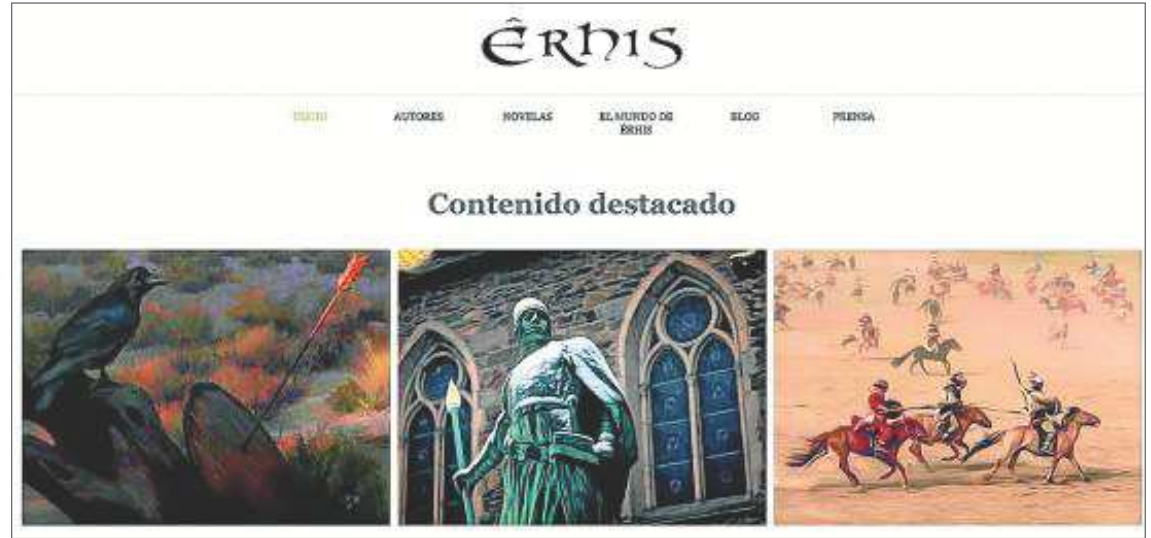
Arriba, portal de acceso a la página web del universo Êrhis, creada por los escritores; a la izquierda, portadas de sus dos novelas e ilustración realizada por Lola Basavilbaso de uno de los personajes del mundo de Êrhis. JAVIER FLORÍA